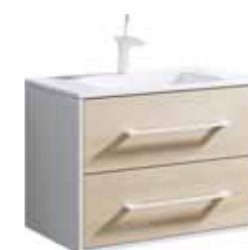
Тумба 75 см Умывальник Malaga 750 MAI0175 MaL.75.04.D

Подвесная тумба с двумя ящиками под умывальник из литьевого мрамора Ш: 76 – В: 54 – Г: 46