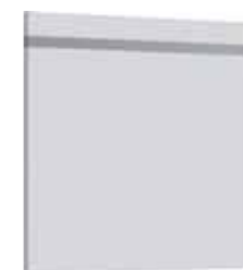
Зеркало 65 см MaI.02.06

Зеркало 65 см со светодиодной подсветкой и сенсорным выключателем Ш: 65 – В: 65 – Г: 2