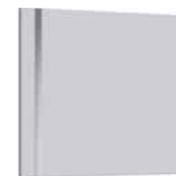
Зеркало 75 см MaI.02.07

Зеркало 75 см со светодиодной подсветкой и сенсорным выключателем Ш: 75 – В: 65 – Г: 2