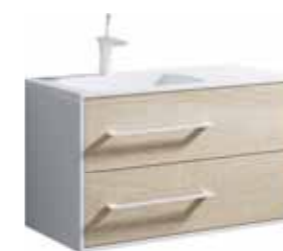
Тумба 90 см Умывальник Malaga 900L MaI.01.09/L MaL.09.04.D-L

Подвесная левая тумба с двумя ящиками под умывальник из литьевого мрамора Ш: 92 – В: 54 – Г: 45