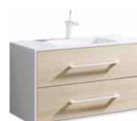
Тумба 100 см Умывальник Malaga 1000 MAI0110 MaL.10.04.D

Подвесная тумба с двумя ящиками под умывальник из литьевого мрамора Ш: 97 – В: 54 – Г: 46