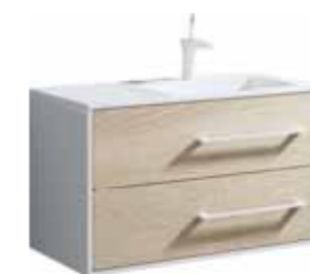
Тумба 90 см Умывальник Malaga 900R MaI.01.09/R MaL.09.04.D-R

Подвесная правая тумба с двумя ящиками под умывальник из литьевого мрамора Ш: 92 – В: 54 – Г: 45