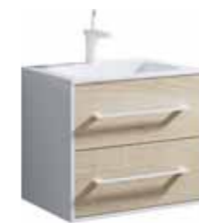
Тумба 60 см Умывальник Malaga 600 MaI.01.06 MaL.06.04.D

Подвесная тумба с двумя ящиками под умывальник из литьевого мрамора Ш: 62 – В: 54 – Г: 45